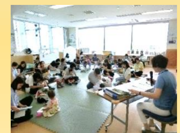
(写真は昨年度の講座の様子です。)